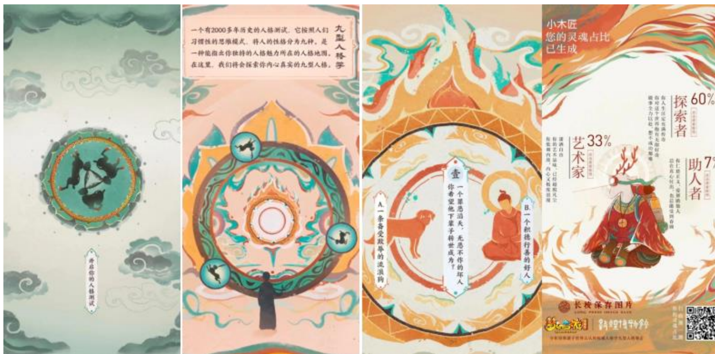
梦幻西游 + 敦煌博物馆H5界面

常见的推广目的有： 展示介绍 、 品牌传播 、 活动营销 、 数据收集 、 用户导流